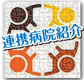
沖縄病院と連携していただいている医療機関をご紹介します