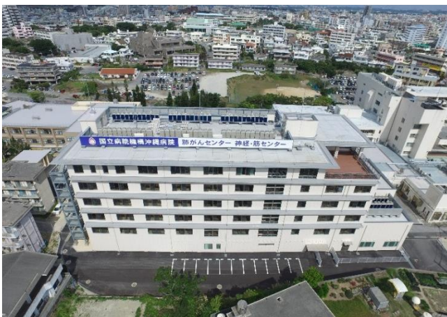
南病棟 沖縄高速道路側からの眺望

医師の絶対数が少ない過度期の中で全力を尽くして奮闘して今日の沖縄病院を築いてくださった諸先輩方のパワーに改めて敬意を表したいと存じます。